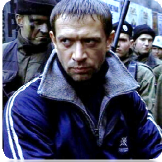
Commander, General Miroslav Lokar

LAGE am Boden Überwachungskräfte melden, dass das 2080th Motor Rifle Battalion die Kaserne in der Ortschaft NAJU in Richtung Südwesten verlassen hat. Wir müssen davon ausgehen, dass die Suche nach Capt O'Grady nicht unbemerkt geblieben ist. Die starke Einheit, unter dem Kommando von General Miroslav Lokar , braucht ca. 1 Std. bis nach JISA. Auftrag an die 1st GW: „Zerstören Sie asap die MOKPO-Bridge und verhindern sie so den Vorstoß der Kräfte in die Rettungszone. Sollte dies nicht gelingen, so ist bei der milit. Überlegenheit und den vorhandenen SAM-Kräften, MANPAD und ZSU-23-4, eine Rettungsoperation ausgeschlossen!“ Eile ist angesagt! Achtung, aufgrund der unklaren Lage der „Moving Forces“ ist der Angriff auf die Brücke nur von Süden aus durchzuführen!