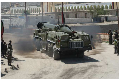
SS-1c Scud-B, Boden-Boden Kurzstreckenrakete