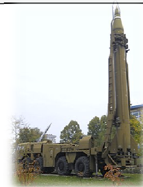
Gefechtskopf 987–989 kg Nukleargefuchtskopf, Chemische Kampfstoffe (Lost, Lewisit, VX), Splittergefuchtskopf, Streumunition